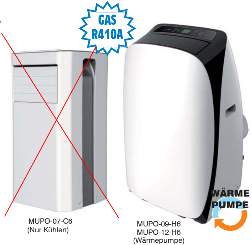
MUPO-07-C6 (Nur Kühlen)

In der drahtlosen Fernbedienung ist ein Temperatursensor eingebaut.