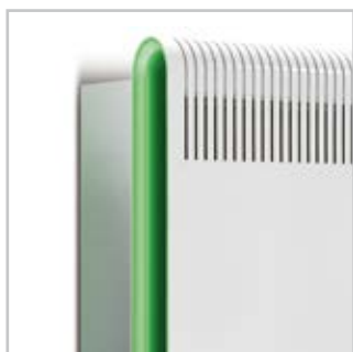
Seitenteil mit LED-Lichtfunktion