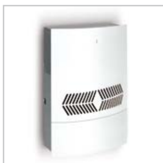
REMKO SLE 20 mit Kondensatbehälter