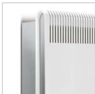
Seitenteil ohne LED-Lichtfunktion