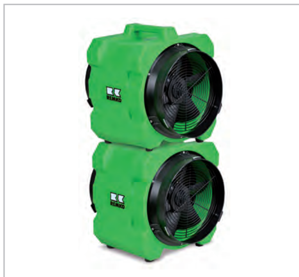
Abb. 2: Stapelung mit max. 2 Geräten

Die Geräte können bei Bedarf platzsparend gestapelt werden.