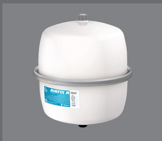
Ausdehnungsgefäß Airfix A