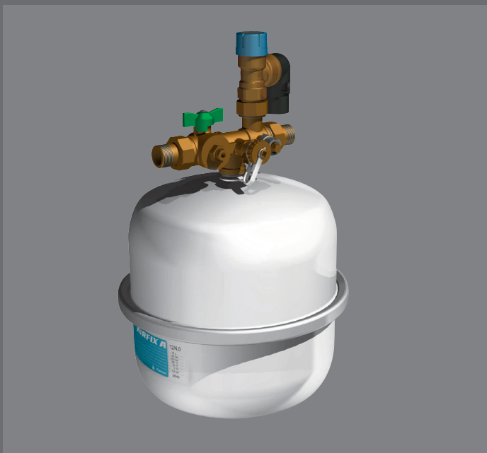
Sicherheitsgruppe R+F Optiline WSE