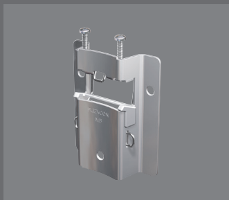
Aufhängezarge MB 3