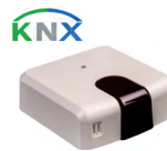
IS-IR-KNX-1i (CL 99 096)