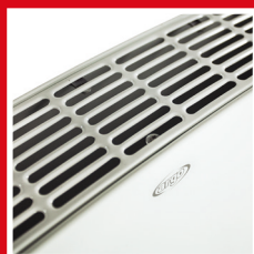
Emissione dell'aria superiore Upper air emission