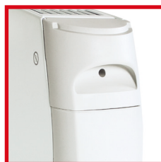
Maniglie laterali per il trasporto Side carrying handles