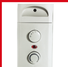
Manopole per la regolazione del termostato e delle modalità Knobs for adjusting the thermostat and operating mode