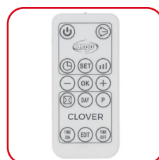
Telecomando slim multifunzione Slim multifunction remote control