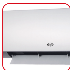
Oscillazione automatica flap Automatic swing of the flap