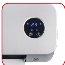
Display digitale tondo con LED blu Original rounded display with blue LED

Perfect for the bathroom, it must be mounted on the wall and is controllable by the infrared slim remote controller. The weekly timer allows for personalized day-by-day programming. The ECO-SMART function adjusts the capacity intelligently and the open window sensor avoids unnecessary waste. Its enveloping lines and minimal aesthetics go well with the matt silver finish of the body.