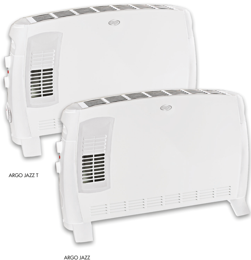
ARGO JAZZ T