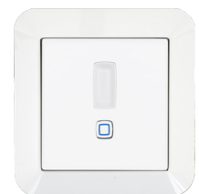
GIRA Standard 55