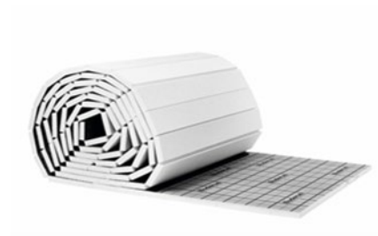
Fig. 2: EPS DES roll

Logafloor EPS DES panels/rolls come with a 5-year warranty.