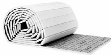
Bild 2: Dämmrolle EPS DES

Es gelten 5 Jahre Gewährleistung auf die Logafloor Tackerflächen.