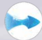
Luftdruck und Druckabbau