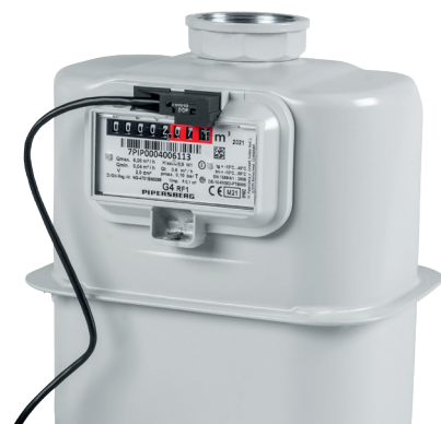
Montage an einem Gaszähler

Montieren Sie die Schnittstelle einfach selbst auf Ihrem Gaszähler. Das Gerät ist mit Gaszählern der Hersteller Elster (Kromschroder, Honeywell), Itron (Pipersberg, Actaris) und Metrix kompatibel, die über eine Vorbereitung für einen Impulssensor verfügen. Diese ist am Modulschacht und der Angabe der Impulskonstanten (z. B. 0,01 m 3 /imp.) auf dem Typenschild zu erkennen. Über einen entsprechenden Adapter (im Lieferumfang enthalten) wird der Sensor am Gaszähler angebracht. Die Erfassung erfolgt über Zählimpulse, die durch einen Magneten im Rollenzählwerk eines herkömmlichen Gaszählers erzeugt werden. Anschließend wird der Sensor mit der Schnittstelle verbunden und über die App ins Smart Home integriert – fertig!